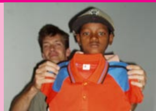
· Jagan past nieuwe kleren met Jagan

Mocht je hierover of n.a.v. deze nieuwsbrief nog vragen hebben, neem dan contact met ons op.