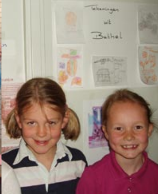
· Kinderen van de Frisoschool en tekeningen uit India