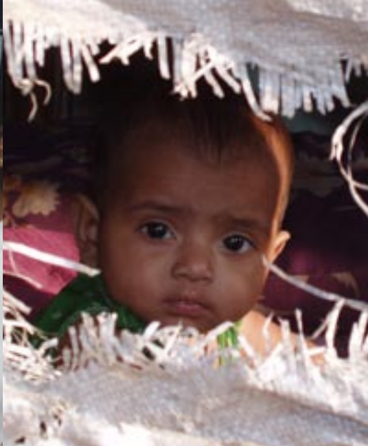
· Kindje uit Puri, Orissa