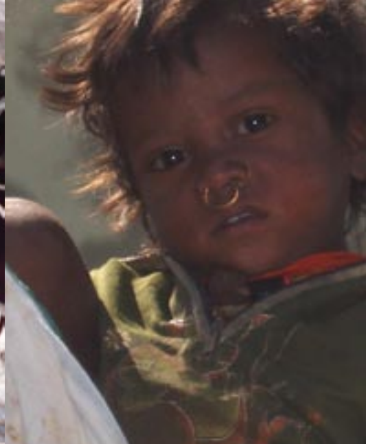
· Tribal-kindje uit Orissa