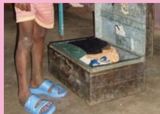
· Jagan met nieuwe slippers