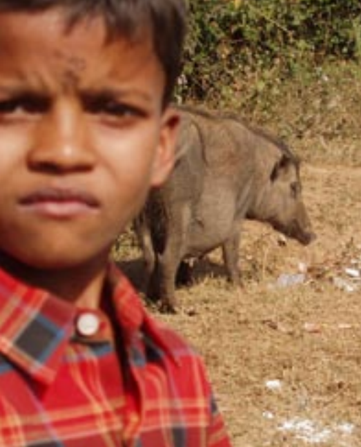
· Varkens uit het dorp op het Bethel terrein