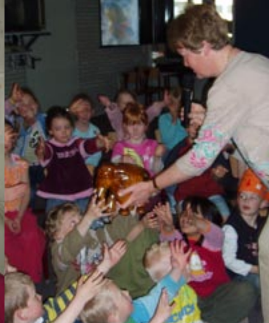
· Presentatie op de Frisoschool