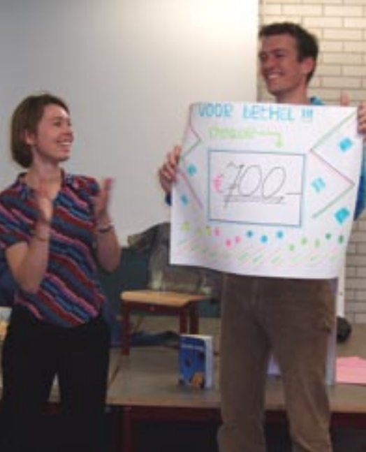
· Overhandiging cheque op de Frisoschool