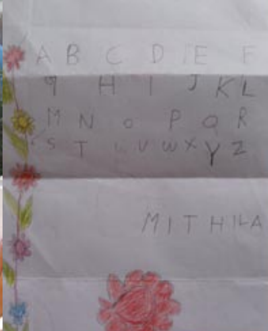
· Brief voor sponsorouders